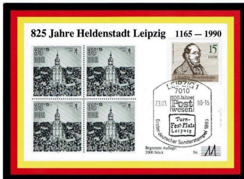
Abb. 3: 825 Jahre Heldenstadt Leipzig , bei dieser angeblichen „Maximumkarte“ fehlen die thematischen und zeitlichen Übereinstimmungen zwischen Briefmarke, Kartenmotiv und Sonderstempel. Keine Maximumkarte!