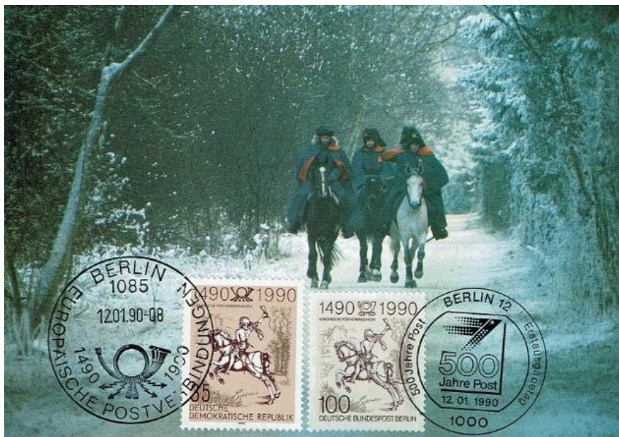
Abb. 1: Maximumkarte (1a) „500 Jahre Postverbindungen in Europa“