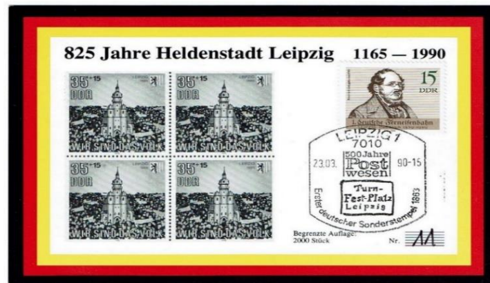
Abb. 3: 825 Jahre Heldenstadt Leipzig , bei dieser angeblichen „Maximumkarte“ fehlen die thematischen und zeitlichen Übereinstimmungen zwischen Briefmarke, Kartenmotiv und Sonderstempel. Keine Maximumkarte!

(*) Anmerkung: Diese Ausgabe wurde 1984 auch vom VEB Philatelie Wermsdorf auf 5 Maximumkarten (ohne Angabe des Herausgebers) mit ESSt 1085 Berlin vom 21.02.84 herausgegeben (s. Seite 5).