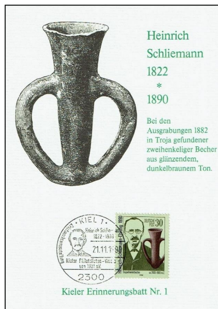
Abb. 4: Kieler Erinnerungsblatt Nr.1 , es wurde keine Post- bzw. Ansichtskarte verwendet.

Anmerkung: Das SPWz 100. Todestag H. Schliemann (Mi.Nr. 3364) wurde am 2.10. 1990 von der DDR-Post herausgegeben. Alle DDR-PWz, die ab dem 2.7.1990 in der DM-Währung herausgegeben wurden (Mi.Nr. 3344 bis 3365), waren bis zum 31.12. 1991 in ganz Deutschland (also im VG Ost und im VG West) postgültig .